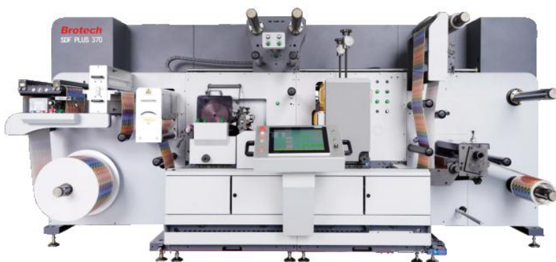
La ligne de finition numérique SDF, en 330 à 520 mm de laize, a été conçue pour la finition numérique et comprend groupe flexo, découpe rotative ou semi-rotative et marquage à froid.

L'agent et importateur de machines pour l'étiquette et l'emballage, Techpack, vient de signer un accord de commercialisation avec Brotech. Si cette entreprise est chinoise, son développement s'appuie des bureaux et showroom partout dans le monde.