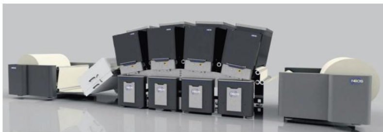
La presse jet d'encre Bombardier B Roll pour supports flexibles. Différentes marques de têtes jet d'encre peuvent être utilisées selon les besoins et la machine peut monter jusqu'à 126 mm.

Avec ce nouveau commettant, Techpack et ses cinq collaborateurs (qui fêtent leur huit ans cette année) disposent d'un portefeuille complet en impression d'étiquettes avec la flexo (Lombardi, Flexoless), l'offset (ZZE Europe) et le jet d'encre (Neos), sans compter les lignes de façonnage (Brotech) et les équipements périphériques : Flexo Wash (petite laize), Lundberg Tech, Vetaphone et Kelva. ■